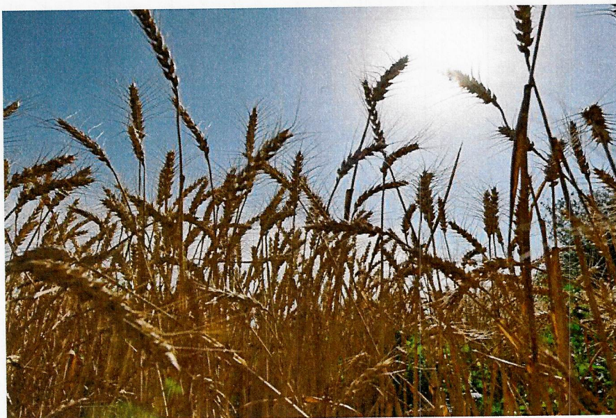
种植作物成熟照片（用于佐证作物成熟）